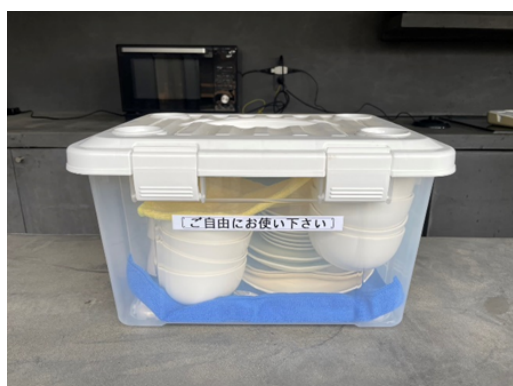
中に入っているもの