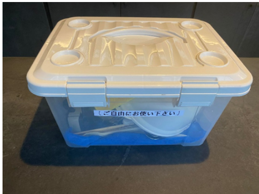
中に入っているもの